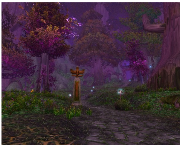
Paysage des elfes de la nuit, Capture d'écran World of Warcraft, 1

Ils rappellent d'autres MMORPG occidentaux et ne s'en détachent que du point de vue de la finesse. On pense en premier lieu à World of Warcraft, modèle du genre. On retrouve tout d'abord de nombreuses ambiances présentes dans ce jeu (tout est vert dans la forêt, les nuits sont violettes, ...)