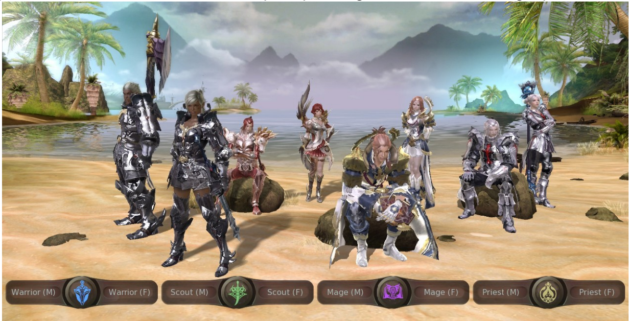
Création de personnage : Choix de la classe et du sexe , Capture d'écran AION, 8