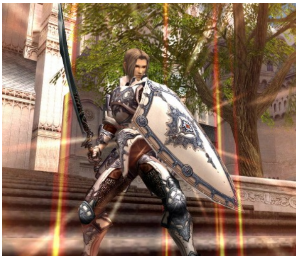
Capture d'écran Lineage2