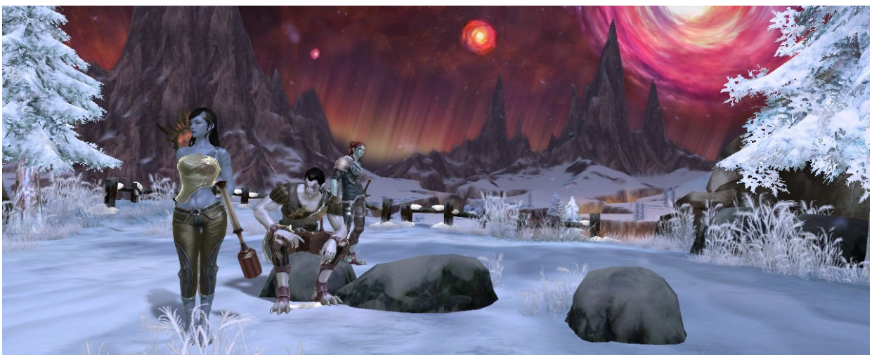
Page de sélection de personnages Asmodéens, Capture d'écran AION, 2

et Elyséens en bas (Daevas aux ailes blanches).