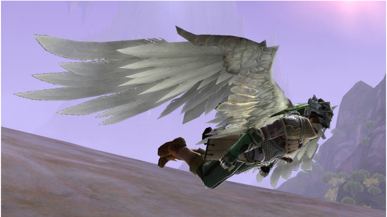
Avatar d'un personnage Elyséen en vol, Capture d'écran AION, 5