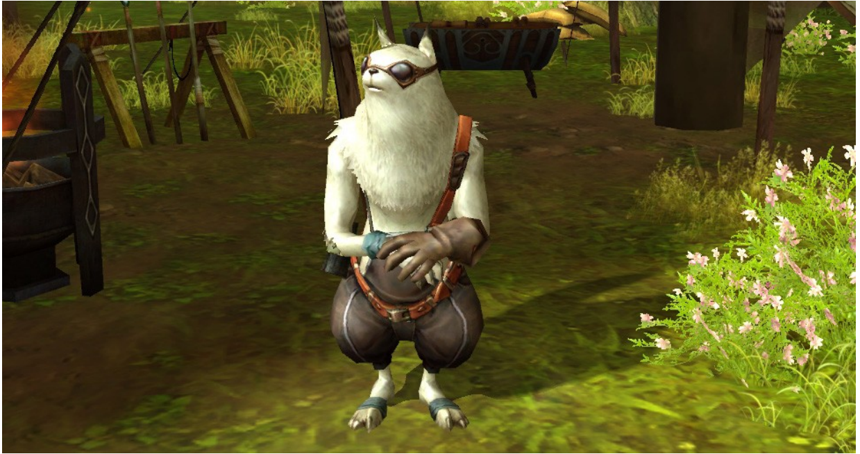
Shugo marchand dans la ville de départ des Elyséens, Capture d'écran AION, 3

des Kralls, barbares agressifs et des Maus, tigres proches de la nature mais également belliqueux. Et des En plus de ces humanoïdes, le jeu est peuplé de tout un tas d'animaux mignons ou agressifs.