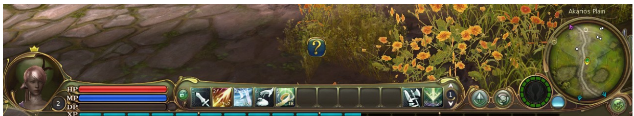
Interface, Capture d'écran AION, 9