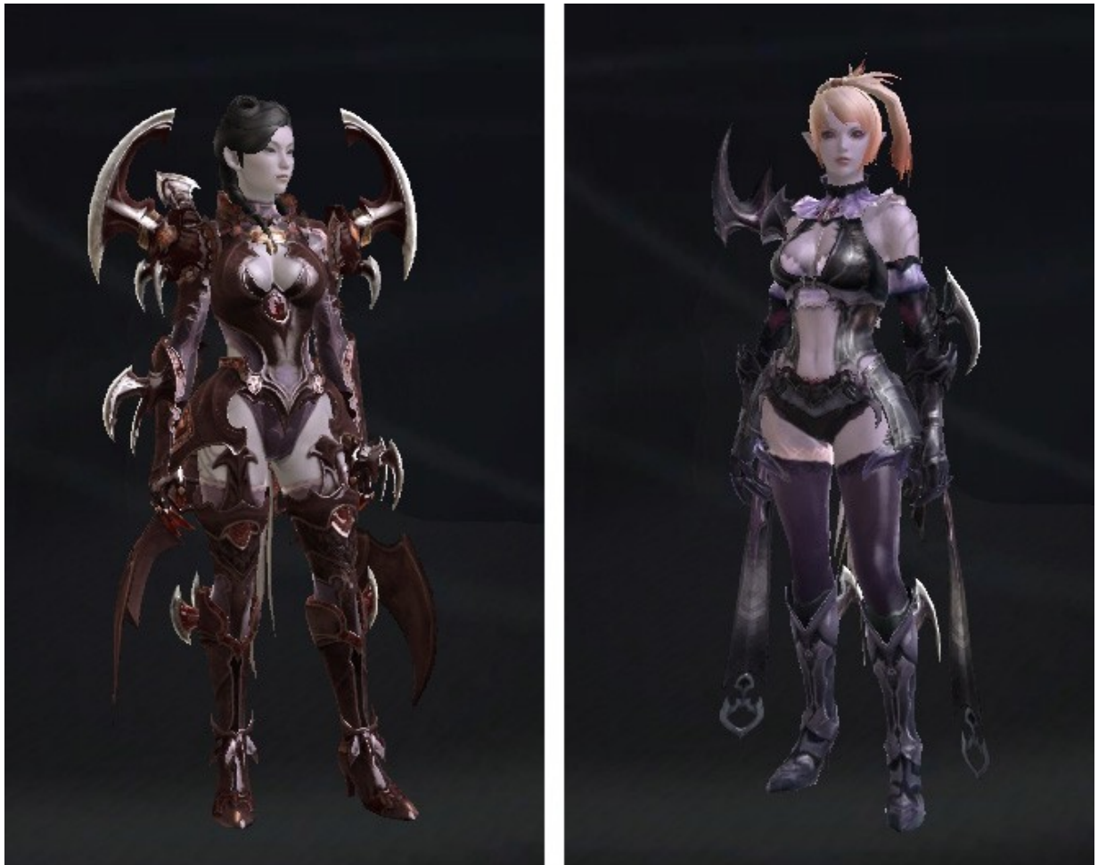
Personnages féminin en armure, Capture d'écran AION, 12

Les personnages féminins ont tous de très grandes jambes que la plupart des armures, même lourdes, laissent apparaître, ce qui est également classique des mangas.