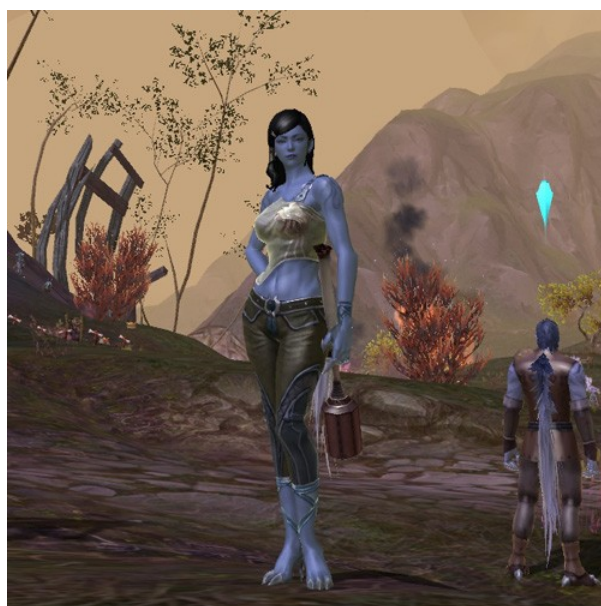
Personnage bien intégré, Capture d'écran AION, 18