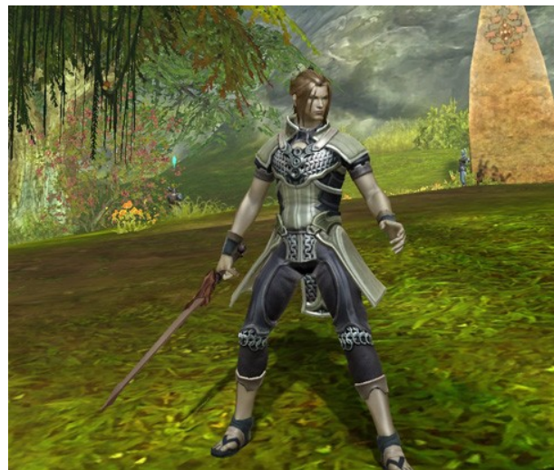
Capture d'écran AION, 11

Les visages vont du personnage relativement réaliste mais idéalisé suivant les normes asiatiques au personnage de manga très exagéré (avec de grands yeux notamment). Les personnages masculins ont des visages généralement très efféminés (à l'instar de beaucoup de personnages de mangas japonais).