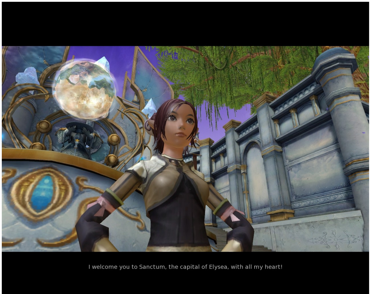
Extrait d'une cinématique, Capture d'écran AION, 10

Il existe deux types de quêtes : celles qui sont essentielles à l'évolution du personnage (en doré) et celle qui sont secondaires (en bleu). Les quêtes principales donnent lieu à des cinématiques basées sur le moteur du jeu.