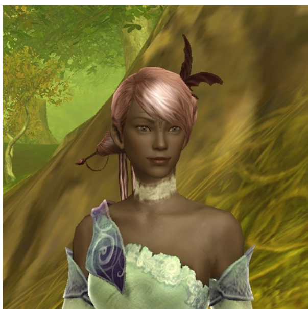
Personnage proche du décor : on voit la différence de définition, Capture d'écran AION, 17