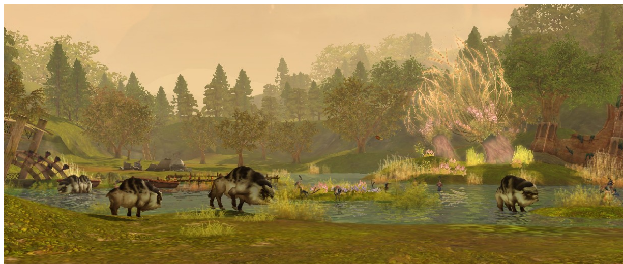
Paysage Elyséen, Capture d'écran AION, 16