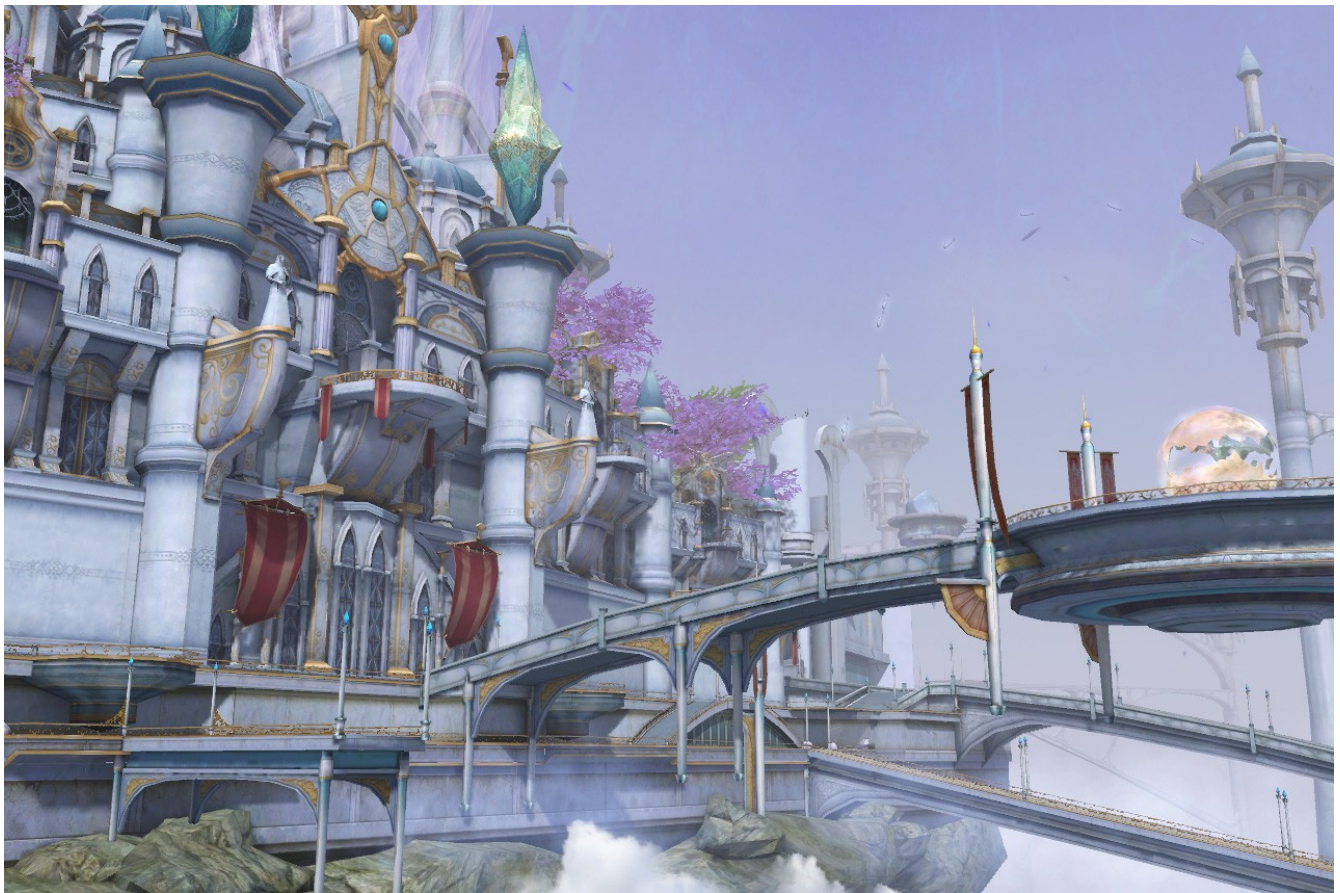
Sanctum, capitale des Elyséens, Capture d'écran AION, 1

En contrepartie, le jeu risque de déplaire aux hardcore gamers (du fait de la simplicité du gameplay, même si progresser demande beaucoup de temps) et aux roleplayers (du fait du gameplay très directif qui laisse peu la place pour raconter ses propres histoires et de la communauté potentiellement jeune, comme dans World of Warcraft).