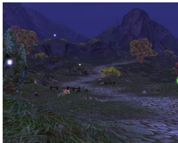
Paysage Asmodéen, Capture d'écran AION, 14