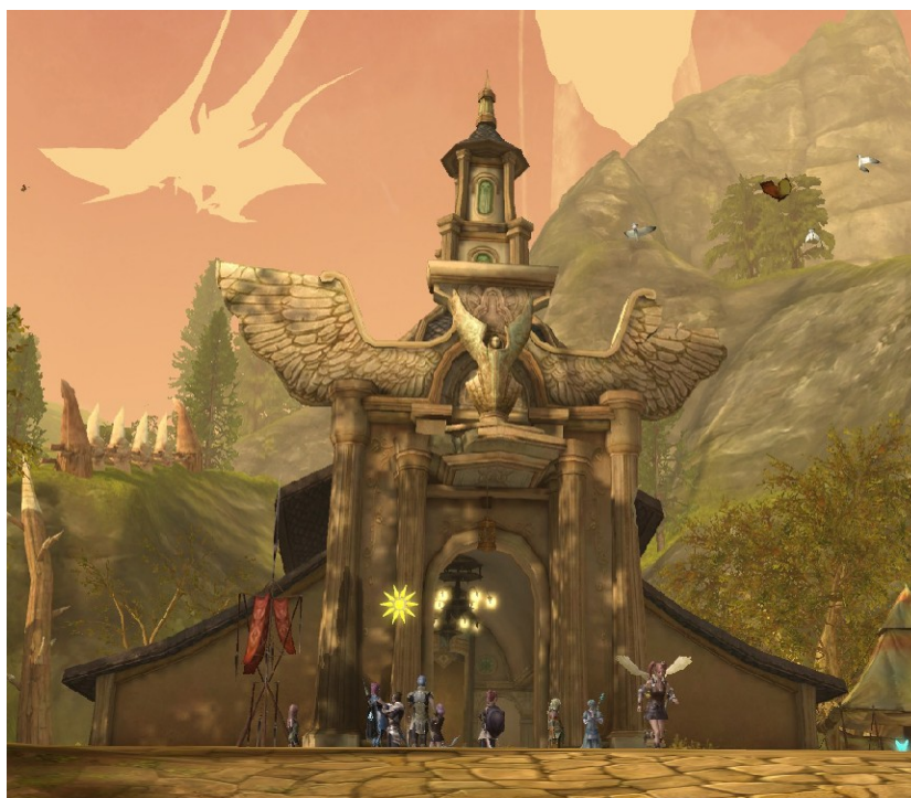
Bâtiment Elyséen, Capture d'écran AION, 15

De plus, les décors sont modélisés et texturés d'une manière très similaires : les bâtiments et éléments naturels sont toujours un peu tordus et avec des formes douces et les textures semblent peintes numériquement avec le même traitement cartoon.