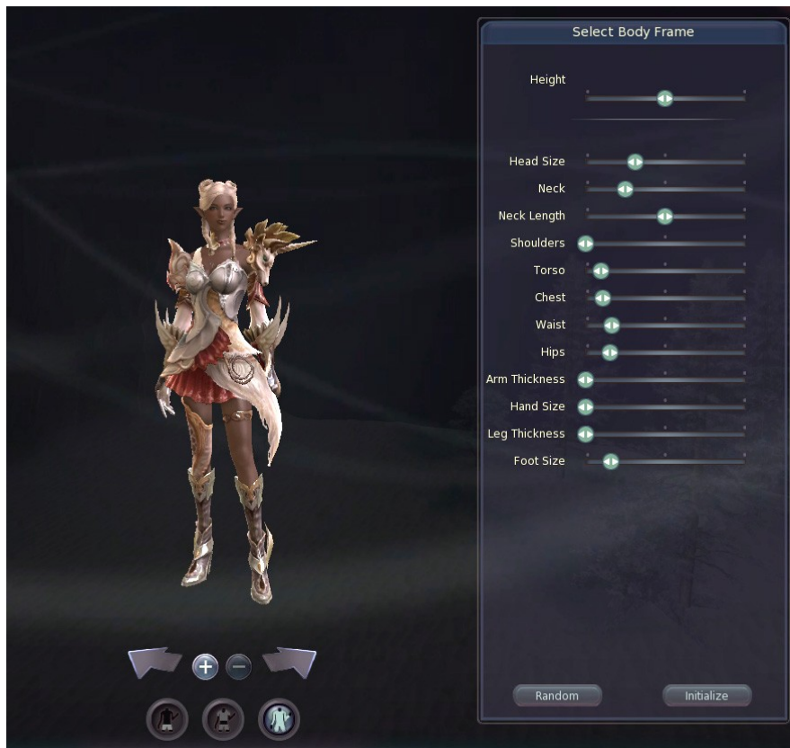
Création de personnage : modifications du corps, Capture d'écran AION, 6