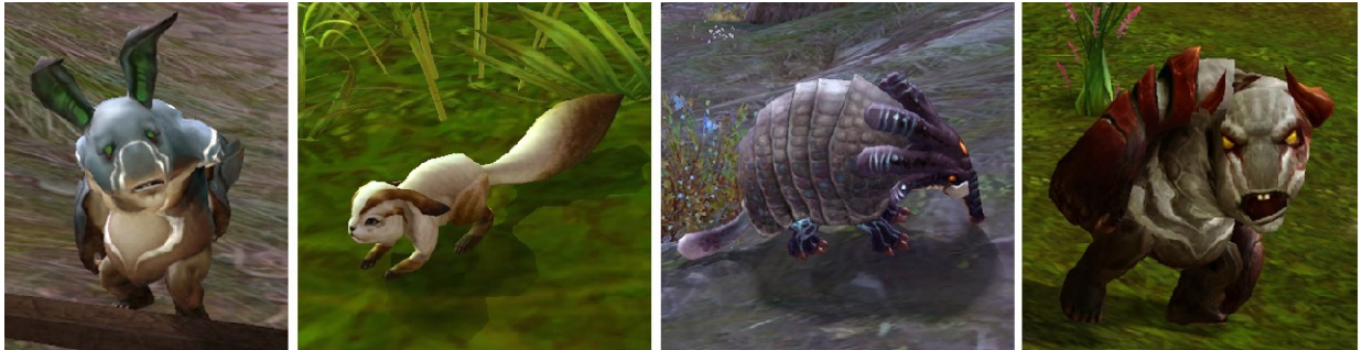
Divers animaux et monstres d'AION, Capture d'écran AION, 4

des Kralls, barbares agressifs et des Maus, tigres proches de la nature mais également belliqueux. Et des En plus de ces humanoïdes, le jeu est peuplé de tout un tas d'animaux mignons ou agressifs.