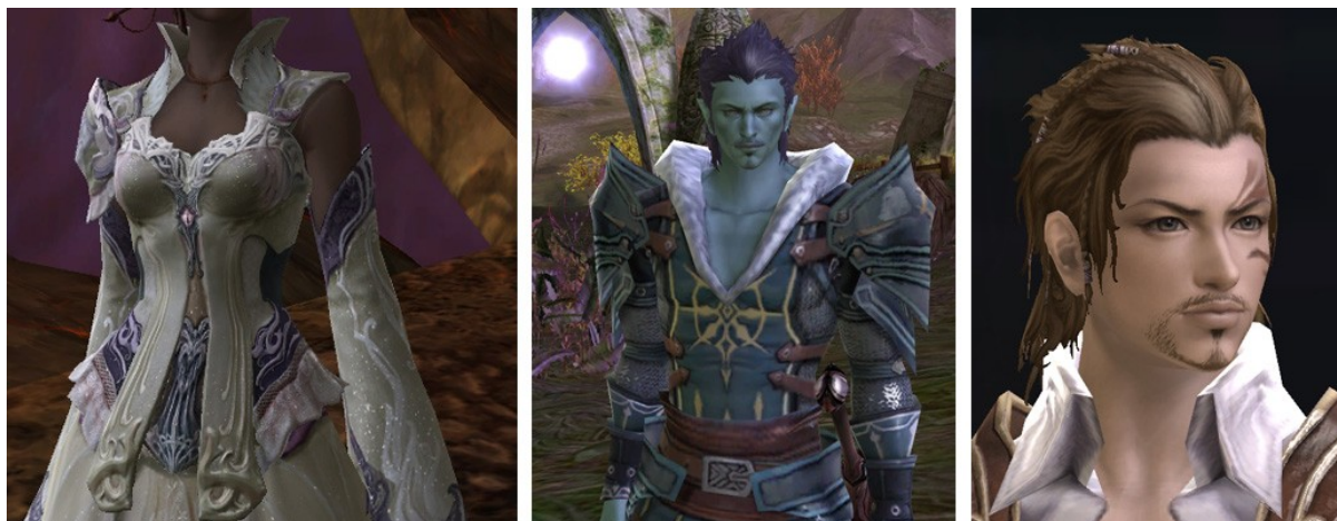
Textures de vêtement, d'armure et de visage, Capture d'écran AION, 13

Les textures des personnages (visage, peau et armures) sont un intermédiaire entre cartoon et réalisme. La définition est importante : il y a de nombreux détails et reliefs.