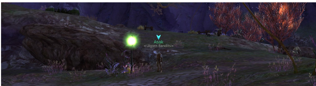
Personnage non joueur proposant une quête, Capture d'écran AION, 19

L'intérêt et le plaisir esthétique laisse rapidement place à la compétition, l'efficacité du gameplay. Les flèches au dessus des PNJs sont un bon exemple : cela facilite la vie du joueur qui voit directement où aller, mais cela n'incite pas à la découverte, à la flannerie et limite l'immersion.