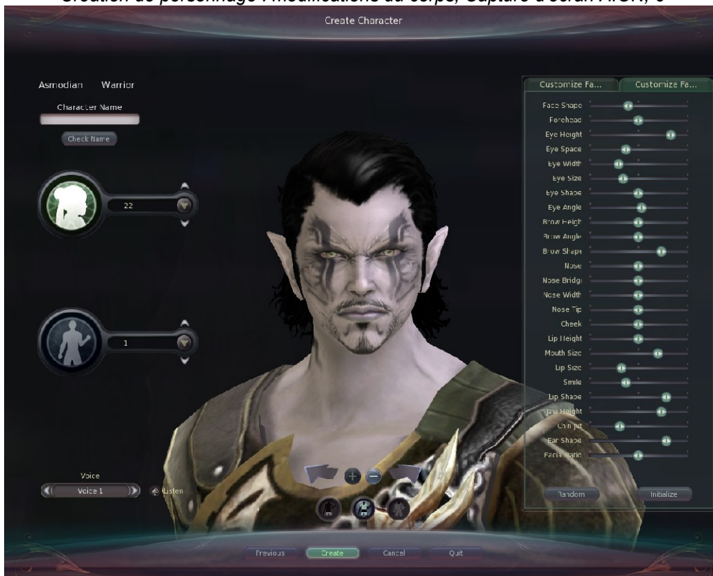
Création de personnage : modifications du visage, Capture d'écran AION, 7